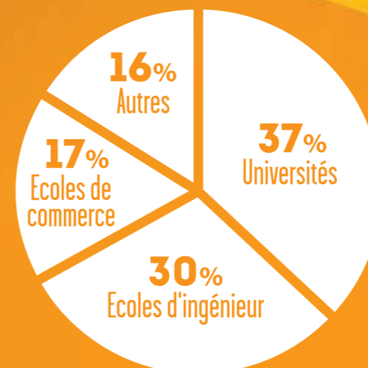
Origine des étudiants